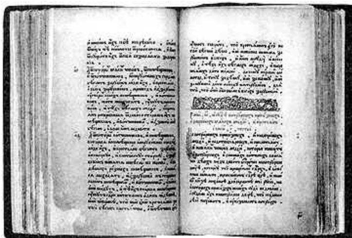
Рис. 3. Соборное Уложение. Москва. Печатный двор. 1649 г.