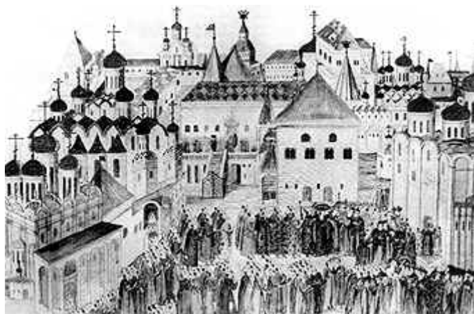
Рис. 2. Соборная площадь Московского Кремля в середине XVII в.

Заседания проходили в царских палатах в трёх главных формах: